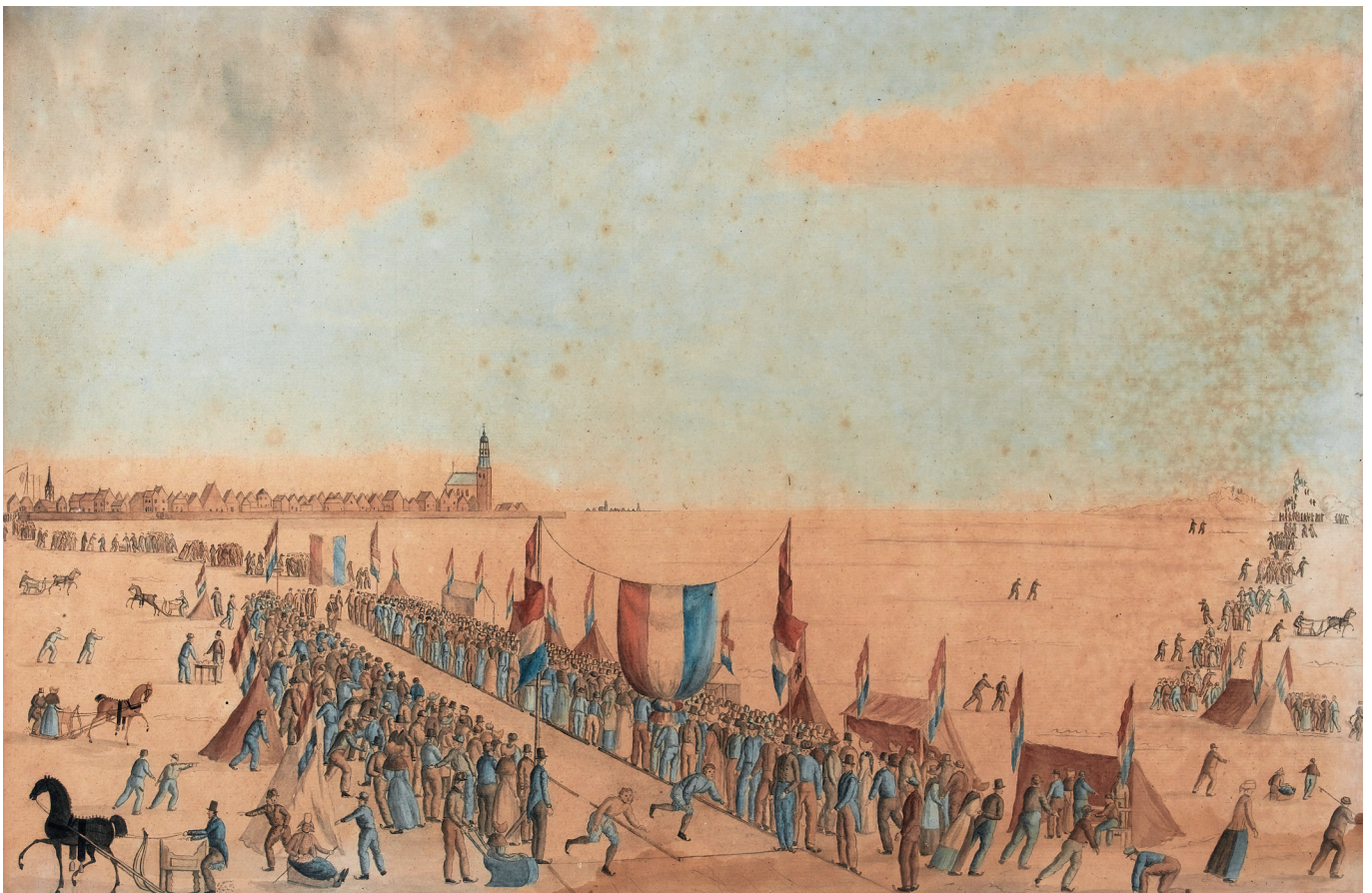
Hardrijderij op schaatsen op zee bij Hindeloopen, door Philippus van Drooge. Aquarel, 1838. Collectie Fries Scheepvaart Museum.