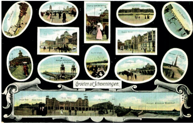
Ansichtkaart van Scheveningen met strandgezichten, boulevard, pier, vuurtoren en hotels, circa 1905. Afbeelding uit Koninginnen aan de Noordzee (met als bron: Collectie Haags Gemeentearchief).

op een internationaal en adellijk publiek. Oostende wordt liefkozend 'la reine des plages' genoemd. De zomerse aanwezigheid van de Belgische Koninklijke Familie geeft extra cachet aan de badplaats. Koning Leopold II initieerde bovendien verschillende stedenbouwkundige projecten.