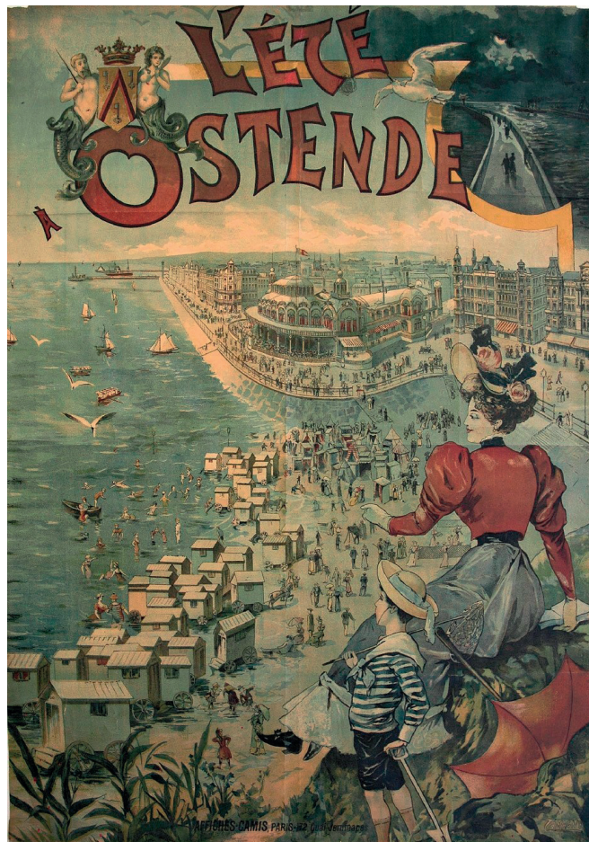
Reclameaffiche voor Oostende, getekend door F. Tamagno en gedrukt door Aff. Camis (Parijs), 1894, 188 x 122 cm. Afbeelding uit Koninginnen aan de Noordzee (met als bron: Beeldbank Oostende).

Oostende was oorspronkelijk een vissersplaats en zeehandelshaven, die bovendien als militair bastion werd gebruikt. In de loop van de negentiende eeuw ontwikkelt Oostende zich tot één van de belangrijkste badplaatsen van Europa, met grote aantrekkingskracht op de haute bourgeoisie van Brussel, maar ook